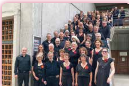
Mini festival "Après un rêve..." Chœur Symphonia "Les Sept Paroles du Christ en Croix" Dimanche 2 juin 2024 - 17h Eglise de Villars