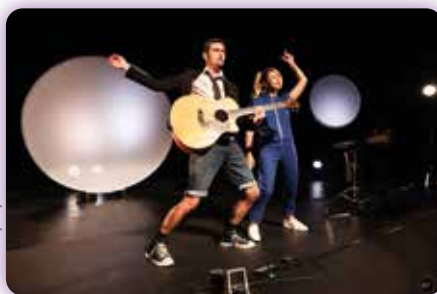
Jeune public - Cie La Fée Mandoline "Mots pour Mômes" Mercredi 17 avril 2024 - 15h Salle de spectacles - Médiathèque