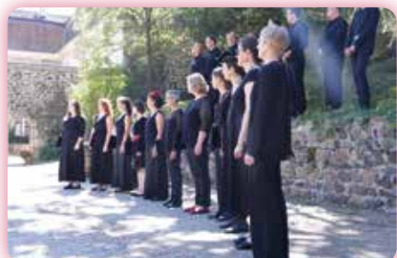
Mini festival "Après un rêve..." Chœur Sinfonietta "La Naissance de Vénus" Samedi 1 er juin 2024 - 20h30 Eglise de Villars