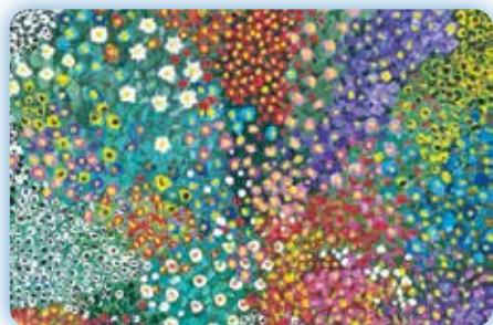
Expo peinture - Léonie Laffitte Du 9 au 27 avril 2024 Salle d'expositions - Médiathèque