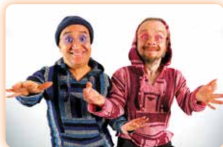
Humour - Les Glandeurs Nature "Elevés en plein air" Samedi 4 mai 2024 - 20h30 Salle de spectacles - Médiathèque