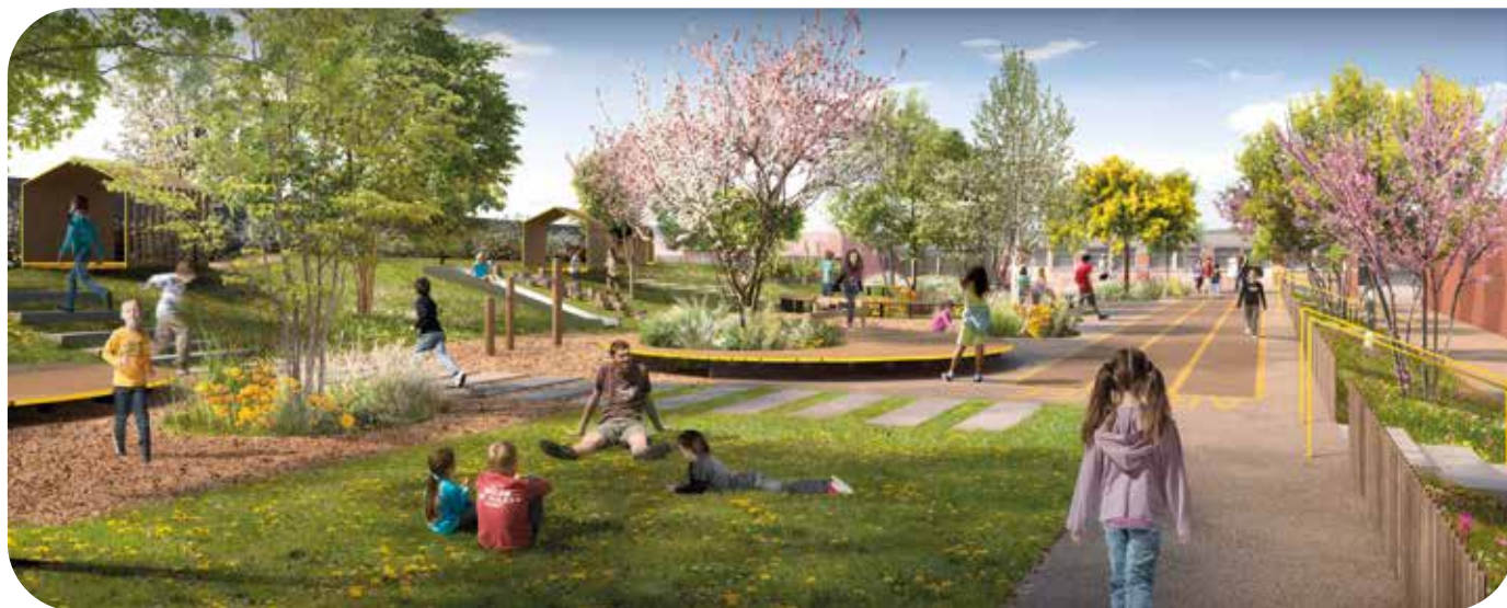
Visuel d'ambiance fourni par Axe Saône.

Les travaux d'aménagement des espaces extérieurs commencent cet été !